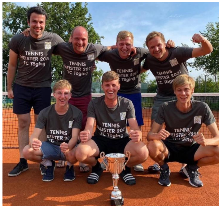
Meistermannschaft der Herren Saison 2021

So konnten wir im vergangenen Jahr 4 Mannschaften im aktiven Spielbetrieb melden. Dazu zählte mit den Knaben (6. Platz in der Bezirksklasse 3) eine Jugendmannschaft, sowie mit Herren (1. Platz in der Bezirksklasse 2), Herren 40 (5. Platz in der Bezirksklasse 2) und Herren 50 (3. Platz in der Bezirksliga) 3 Seniorenmannschaften.