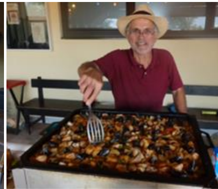
Eindrücke vom Finaltag der Tennis Vereinsmeisterschaften 2021

Am 21.08.2021 fand auf unserer Tennisanlage ein Leistungsklassen (LK-) Turnier für Herren und Damen Konkurrenzen statt. Dabei messen sich Spieler aus verschiedenen Vereinen mit ähnlicher Spielstärke um ihre Ranglistenposition zu verbessern. Dieses fand regen Anklang und ist für den Verein stets eine willkommene Einnahmequelle.