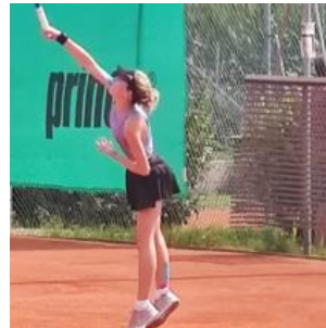
Eindrücke vom LK-Turnier am 21.08.2021

Zudem führten unsere Herren 40 fast schon traditionell ihren Masters Cup durch, um den besten Tennisspieler unter Ihnen zu ermitteln.